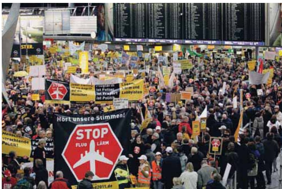
Tausende protestieren jeden Montag am Frankfurter Flughafen gegen den Fluglärm.