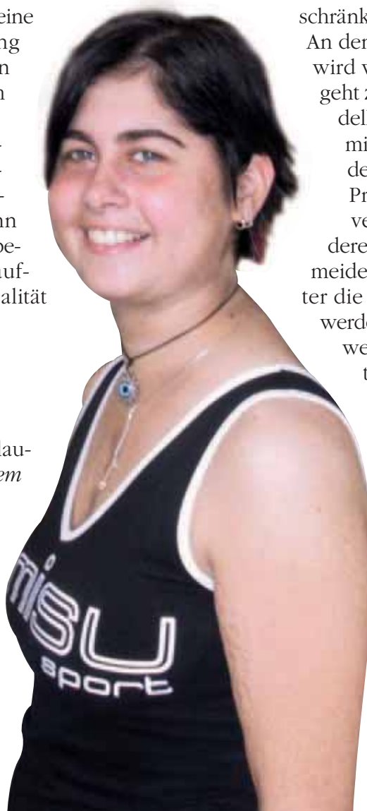
Die gleiche Patientin nach der Transplantation.

Diese Entwicklungen werden dazu führen, dass in Zukunft das Leben mit einem Kunstherzen weiter verbessert wird.