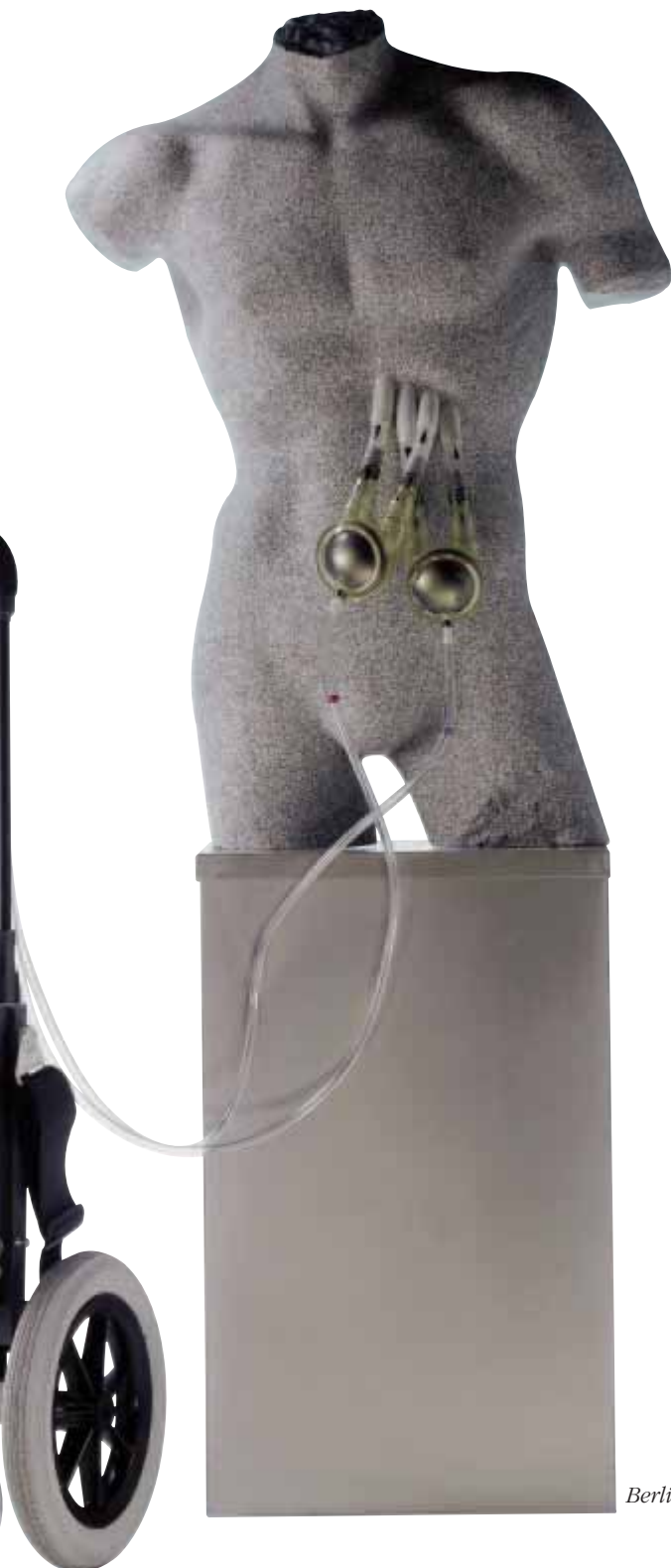
Berlin Heart Excor

Eine weitere Ursache der schweren Herzschwäche ist die dilatative Kardiomyopathie , bei der es zu einer deutlichen Überdehnung des Herzens kommt. Sie tritt vorwiegend bei Männern in einem Alter zwischen dem 30. und dem 50. Lebensjahr auf. Diese Erkrankung kann aufgrund genetischer Faktoren, aber auch durch äußere Faktoren wie exzessivem Alkoholgenuss oder durch die Einnahme bestimmter Medikamente auftreten. Sie wird auch als Folge einer Herzmuskelentzündung beobachtet, kann aber auch ohne vorhergehende Erkrankung auftreten. Bei den Patienten kommt es ebenfalls zu Zeichen einer zunehmenden Herzleistungsschwäche mit Luftnot und einer Minderversorgung der Organe mit Sauerstoff.