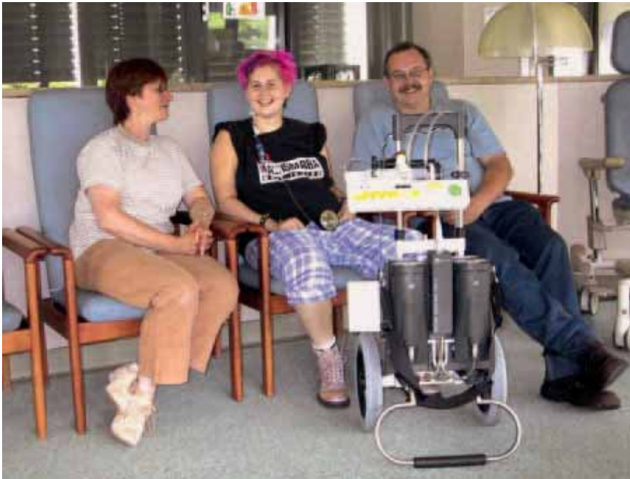
15-jährige Patientin am Berlin Heart Excor BVAD.

Außerdem kommt das Blut in dauernden Kontakt mit der künstlichen Pumpenoberfläche. Dadurch wird die Bildung von Blutgerinnseln gefördert mit dem Risiko für Thrombosen und Embolien. Eine Hemmung der Blutgerinnung ist notwendig, bei der zusätzlich zu Marcumar je nach Modell noch ASS oder Clopidogrel gegeben wird. Diese Gerinnungshemmung ist eine schwierige Gratwanderung: Ist die Gerinnungshemmung zu niedrig, kann es zu Schlaganfällen kommen, ist sie zu hoch zu Gehirnblutungen.