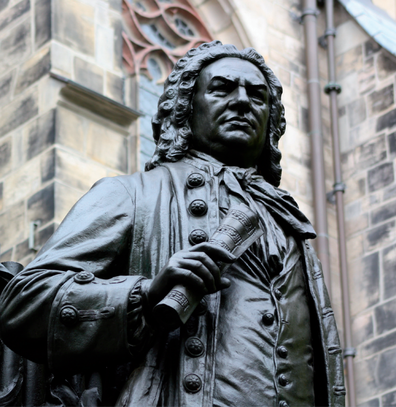
Johann Sebastian Bach